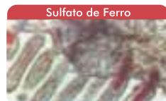
Sulfato de Ferro