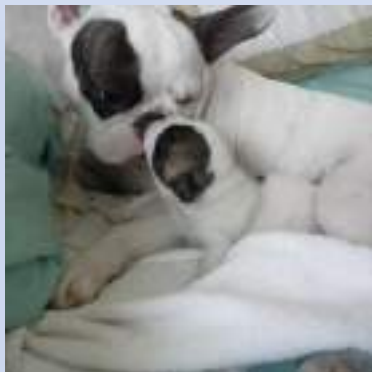
Poesia e Anja