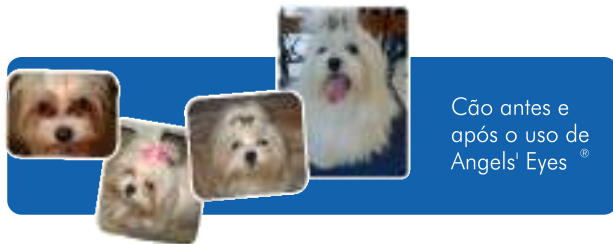
Cão antes e após o uso de Angels' Eyes ®

Angels' Eyes ® é o primeiro produto especificamente desenvolvido para auxiliar a eliminação das manchas avermelhadas ao redor dos olhos de cães e gatos a partir das oito semanas de idade causadas pela lágrima. Angels' Eyes ® também ajuda na eliminação das manchas ao redor da boca, causadas pela saliva.